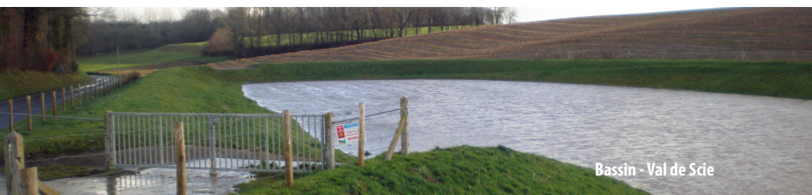
Bassin - Val de Scie

« La présence d'un ouvrage hydraulique ne signifie pas qu'il n'y aura plus d'inondation. Il est calibré pour un certain volume d'eau, au delà, le risque d'inondation est toujours présent ».